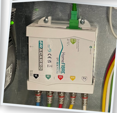
A sinistra, la centrale Fracarro FRPRO EVO IT con il multiswitch compatto a 5 ingressi e 8 uscite derivate, installata nella centrale di testa; a destra in alto il multiswitch SWI908TS a 9 ingressi che alimenta la centrale 3DGFLEX, anch'esso installato nella centrale di testa; sotto, il ricevitore ottico/convertitore ottico-elettrico OPT-RX 4 Micro, presente in due sottostazioni.