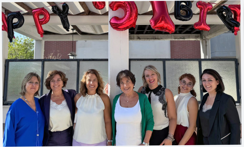
Alcune delle donne che lavorano in Team Office, la cui presenza è trasversale a tutti i settori principali, inclusa vendita, assistenza tecnica, logistica, acquisti, amministrazione, ufficio gare.

In un mondo tecnologico solitamente volto al maschile, è stato fondamentale il confronto tra generi che ci ha permesso di avere l'accesso a punti di vista, approcci e prospettive differenti e che ci ha dato una apertura ed una modernità oggi riconoscibile nel mercato».