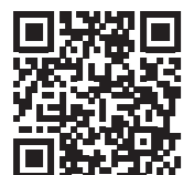
Nel QR Code: Case History Prase