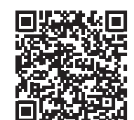
Nel QR Code: Segui Prase su Sistemi Integrati