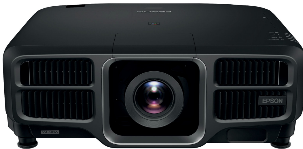
Il nuovo proiettore EB-L1490 offre le stesse caratteristiche dei modelli top di gamma della serie EB-L1000

La tecnologia 3LCD, sviluppata da Epson, è composta da 3 pannelli LCD (RGB, uno per ogni colore fondamentale) per assicurare che la luminosità del bianco (White Light Output) sia uguale a alla luminosità dei colori (Color Light Output). Questo aspetto è fondamentale per valutare la luminosità di un videoproiettore; con altre tecnologie, infatti, questi due valori non coincidono; per questo motivo la resa luminosa sui colori cala significativamente . Negli anni la tecnologia LCD si è evoluta al punto che oggi sia la ruota dei fosfori gialla che ogni pannello LCD vengono prodotti con materiale inorganico, le cui proprietà chimiche si mantengono stabili durante tutta la vita operativa al contrario dei materiali inorganici, tipicamente instabili nel tempo. La stabilità chimica dei materiali garantisce, inoltre, il mantenimento