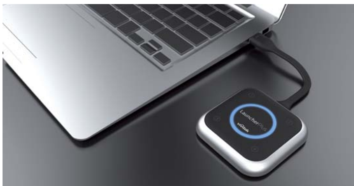
Il Launcher Plus di Vivitek si collega via USB.