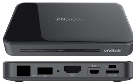
Le interfacce del Novo DS.

L'uscita HDMI supporta segnali Full HD @60 fps e UltraHD-4K @30 fps.