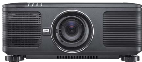
Sopra il proiettore DU8193Z, da 12mila lumen; sulla destra il modello DU9800Z, da 18mila lumen.

D istribuiti in Italia da Screenline, la gamma professionale Vivitek si completa con i due nuovi proiettori laser dedicati al mercato delle grandi proiezioni, dove il produttore di schermi italiano è di riferimento.