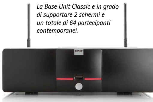
La Base Unit Classic è in grado di supportare 2 schermi e un totale di 64 partecipanti contemporanei.

La Base Unit è incaricata all'elaborazione dei segnali e va collegata direttamente al display o al proiettore della sala riunioni. È stata concepita per supportare fino a 64 connessioni. Il ClickShare Tray viene solitamente posizionato sul tavolo della sala meeting, si integra perfettamente agli arredi tipici di un ufficio e serve unicamente a custodire i ClickShare Button quando non sono utilizzati. Un ruolo fondamentale, per coloro che prendono parte alla riunione, lo ricoprono i ClickShare Button. In questo set ideato da Barco, sono i dispositivi più usati e, una volta collegati tramite porta USB, servono per trasferire in wireless alla Base Unit il contenuto visualizzato sul proprio device. Sarà poi compito della Base Unit smistarli sullo schermo presente in sala per renderlo fruibile a tutti i presenti.