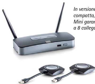
In versione più compatta, la Base Unit Mini garantisce fino a 8 collegamenti.

Per uno strumento di lavoro progettato per interagire con diversi dispositivi, una delle cose fondamentali è quella di essere in grado di riconoscerli per avviare un'interazione. Nel caso di ClickShare, infatti, che si tratti di un notebook, di uno smartphone o tablet, con sistema operato Android oppure iOS, il dispositivo di Barco avvia in modo istantaneo una connessione tra il device e la rete wireless creata opportunamente all'interno della sala meeting. Per farlo, non necessita di collegarsi ad alcun server aziendale, bypassando di fatto ogni tipo di problematica