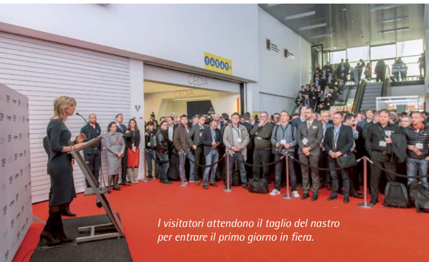
I visitatori attendono il taglio del nastro per entrare il primo giorno in fiera.