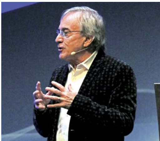
Daniel Lamarre, CEO del Cinque du Soleil.

Un'offerta formativa costituita da centinaia di sessioni diverse per lunghezza, da 20 minuti a sei ore, per la presenza di esercizi pratici e per la possibilità di condividere esperienze, chiarire dubbi o lacune.