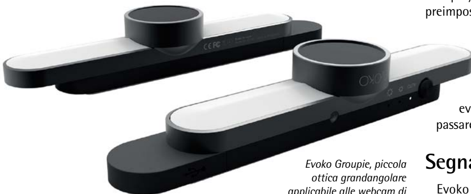
Evoko Groupie, piccola ottica grandangolare applicabile alle webcam di qualsiasi dispositivo.

Evoko Pusco, oltre a realizzare una efficace comunicazione al pubblico, può essere usato